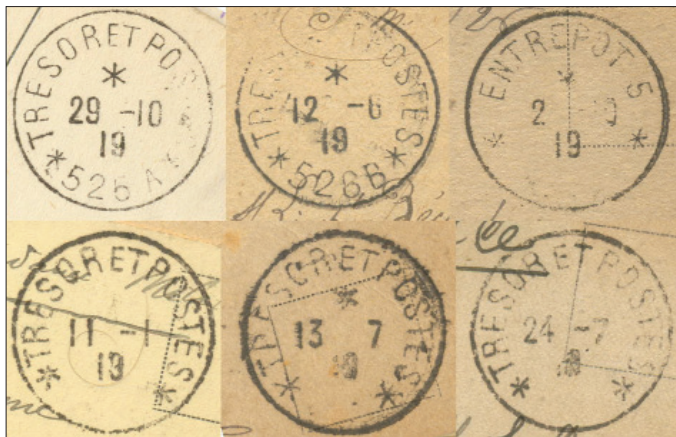
Fig. 21: Exemple de ștampile de poștă militară franceză pe corespondențe din România; rândul de sus: a) TRESOR ET POSTES 526 A (București); b) TRESOR ET POSTES 526B (Galați); c) ENTREPOT 5 * AAO (Giurgiu); rândul de jos: ștampile fără număr din București (primele două) și Galați (a treia).

• by the military French messenger of the Office no. 2 of the French Army Staff, which made the connection twice a week (using the same difficult route of the frozen North through Murmansk) between Paris and the French Mission from Romania and Russia 9 . In this case the correspon-