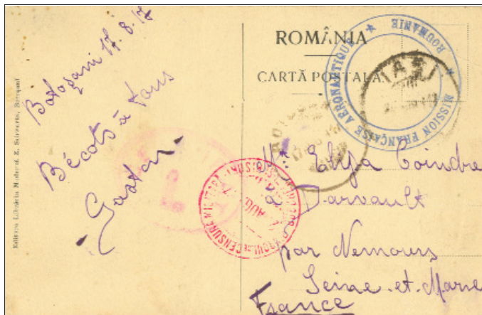
Fig. 18: Carte poștală ilustrată (vedere din Botoșani) expedită la 17 august 1917 din aceeași localitate, prin Poșta civilă română, de către un militar al Misiunii Aeronautice. Cartare BOTOȘANI în aceeași zi, tranzit IAȘI la 20 august (cu cenzura atestată de două ștampile de culoare roșie), pe avers ștampila de tranzit ODESA la 28 august/10 septembrie 1917 (dar fără cenzura rusă, ceea ce este neobișnuit). Corespondența poartă și cașetul cu textul Misiunea Franceză Aeronautică * România (cașet din care există și varianta cu stemă în centru).

Poșta militară franceză folosea sistemul de recomandare, având etichete speciale în acest