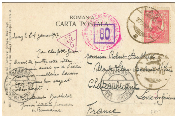
Fig. 17: Carte poștală ilustrată (vedere din Iași) expediată din aceeași localitate la 23 ianuarie 1917 de către locotenentul René Berthelot (instructor de grenadieri în cadrul Misiunii Militare, fără legătură de rudenie cu generalul). Cenzurat la Iași în 28 ianuarie, cartare IAȘI la 29 ianuarie, tranzit PETROGRAD în 30 ianuarie/12 februarie 1917 (cu cenzura rusă confirmată de ștampilele numerale).