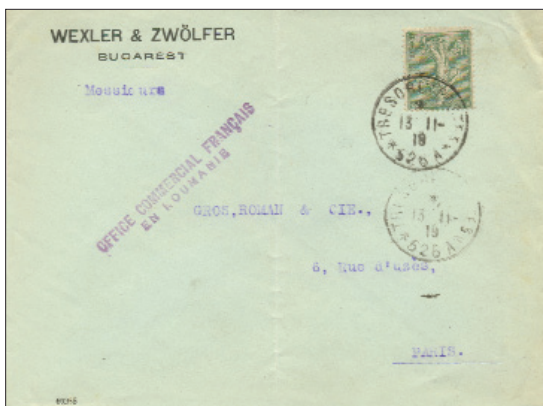
Fig. 22: Plic de afaceri, expediat de către comercianți din București către parteneri din Franța, folosind facilitățile poștei de campanie franceze din România: plicul este corect francat 15 centimes, obliterat la 13 noiembrie 1919 cu ștampila TRESOR ET POSTES 526 A (oficiul centralizator din București al Armatei Dunării); poartă de asemenea ștampila OFICIUL COMERCIAL FRANCEZ ÎN ROMÂNIA, care atestă calitatea comercială a corespondenței (în interes francez) și dreptul consecutiv de a folosi poșta militară.

Fig. 22: Business envelope, sent by traders from Bucharest to partners from France, using the services of the French field post in Romania: the envelope is correctly charged 15 centimes, cancelled on 13 th of November 1919 with the postmark TRESOR ET POSTES 526 A (centralizing post office from Bucharest of the Danube Army); it also bears the postmark OFICIUL COMERCIAL FRANCEZ ÎN ROMÂNIA, confirming the commercial purpose of the mail (in the French interest) and the consecutive right to use the military mail.