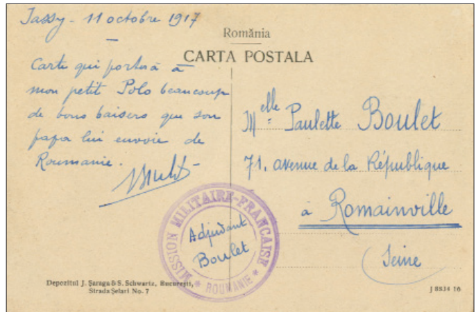
Fig. 20: Carte poștală ilustrată (vedere din Turtucaia), scrisă însă la Iași în 11 octombrie 1917 de către adjutant Boulet (angajat la serviciul cifrului /secretizarea comunicațiilor pe lângă Misiunea, cel care și cenzurează, de altfel, corespondența). Poartă un alt tip de ștampilă administrativă, cu textul Misiunea Militară Franceză * România.

B) În faza a doua a războiului (1919) britanicii au fost prezenți în sudul Dobrogei (Cadrilater), în subordinea Armatei Aliate din Orient. Este vorba de Divizia 26 Britanică , transferată inițial la Ruse la începutul lui noiembrie 1918, ca parte a Armatei aliate a Dunării. Între 28 noiembrie - 1 decembrie 1918 o unitate subor-